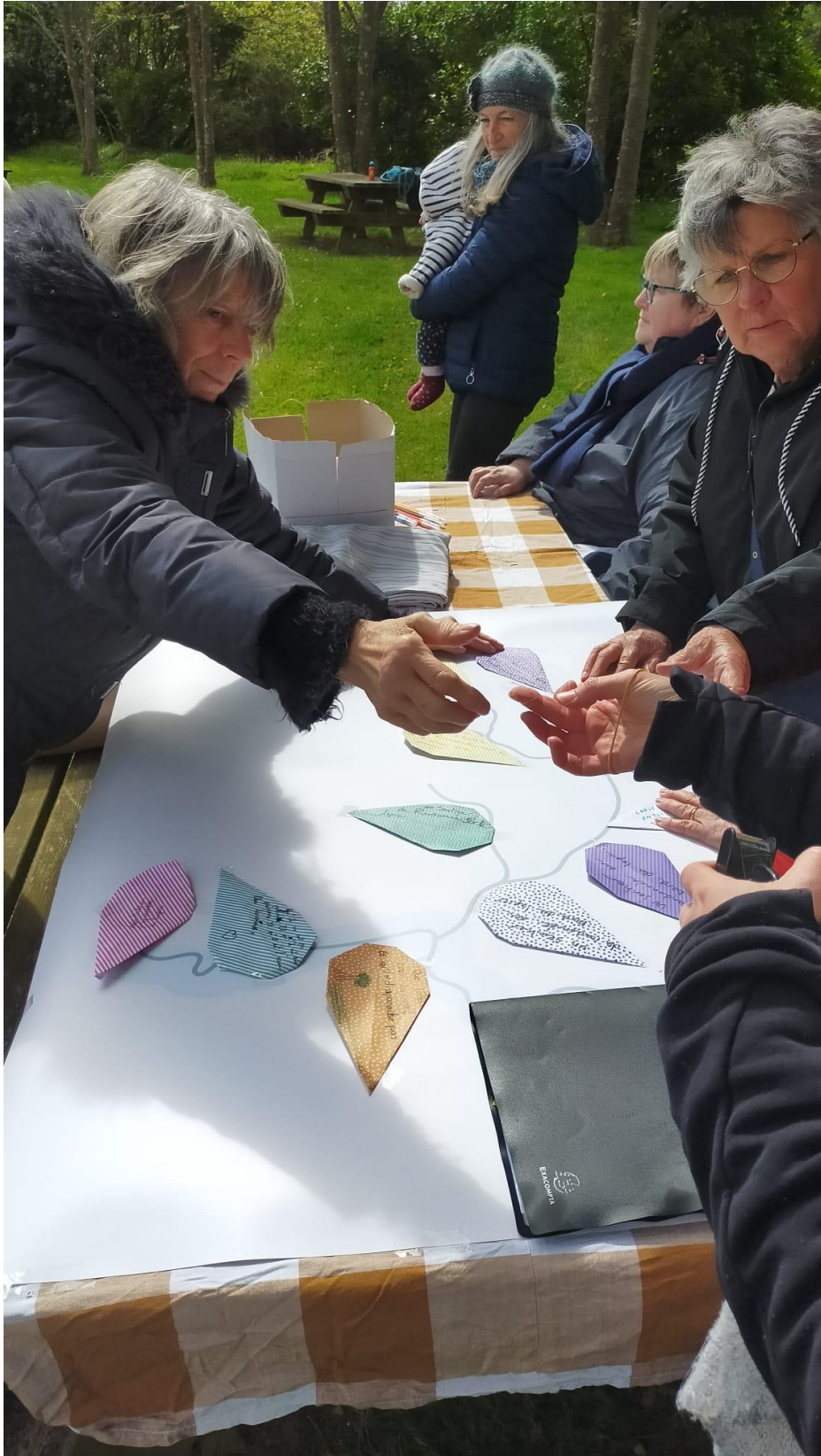
Photo 3 : Atelier « La rivière aux souhaits » : positionnement des souhaits en forme de goutte d'eau sur la carte du Lapon (1)