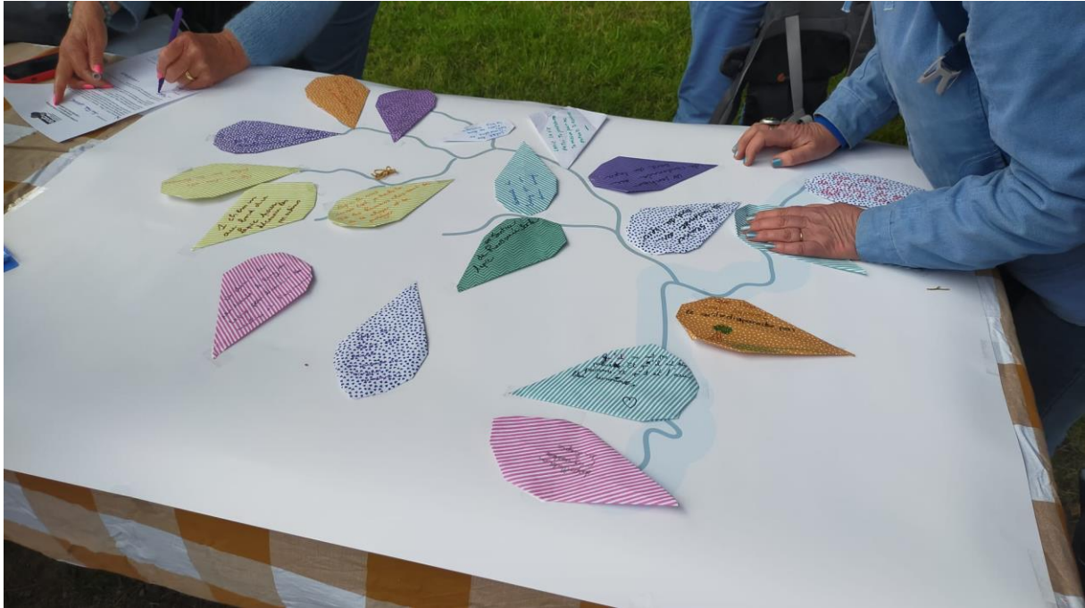
Photo 4 : Atelier « La rivière aux souhaits » : positionnement des souhaits en forme de goutte d'eau sur la carte du Laptic (2)