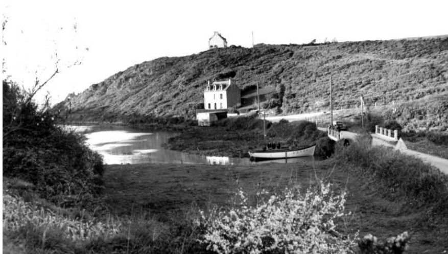
Figure 5 Le pont de Tréfeuntec