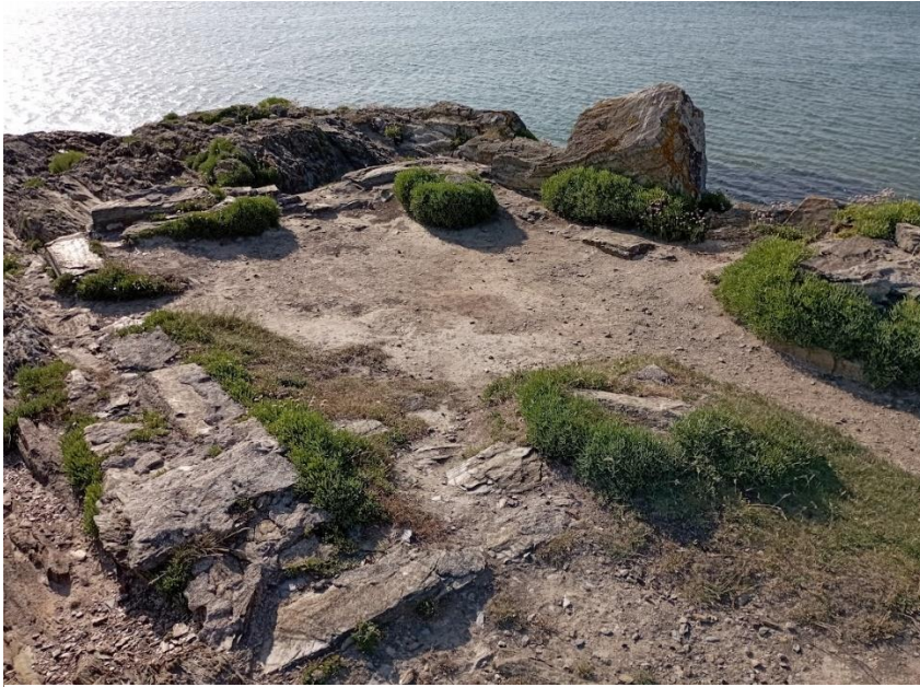
Figure 3 Pointe de Beg an ty garde, maison des douaniers, qui existait jusqu'en 1944