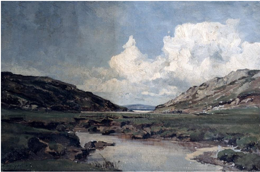
Figure 1 Tableau Sainte la Palud – 1863 (Musée Lansyer – Loches)