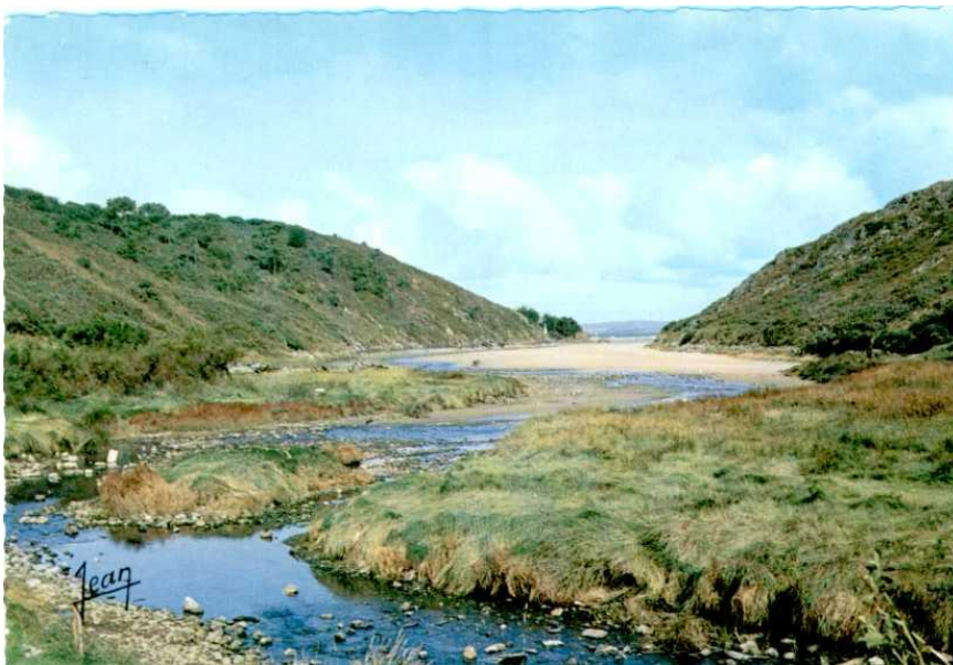
Figure 2 Carte postale 1950

Près d'un siècle sépare ces deux vues de Tréfeuntec.