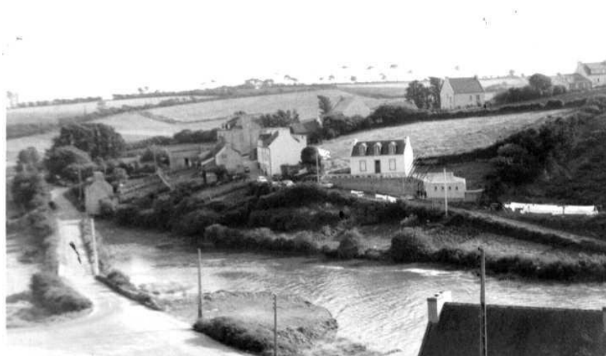
Figure 6 Le pont de Tréfeuntec